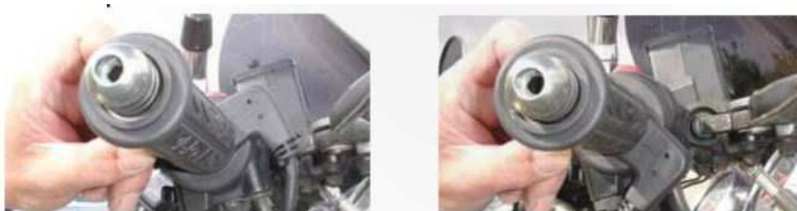
poloha zavřeného plynu